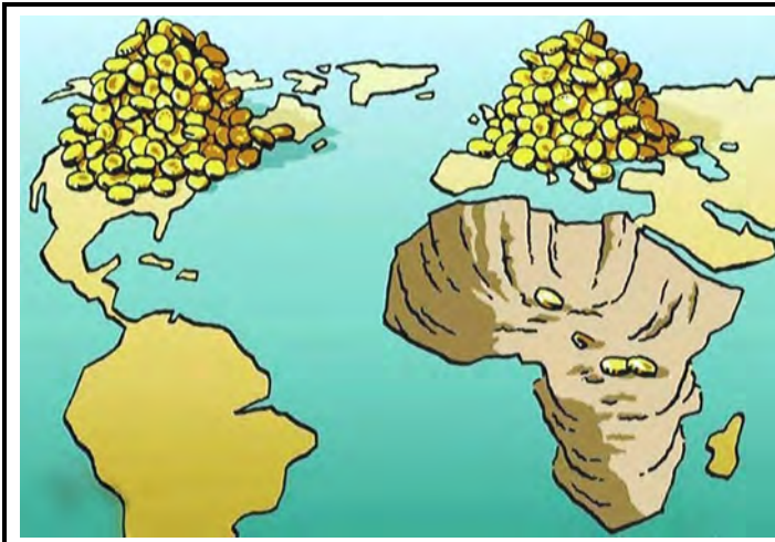
Fig. 3 - “ Il problema non è aiutarli a casa loro, ma liberare casa loro dagli sfruttatori. Smetterla finalmente di sfruttare l’Africa e restituire il maltolto. ”

Secondo un rapporto Oxfam 7 11 miliardi di dollari sono stati sottratti all’Africa nell’arco del solo anno 2010, grazie all’utilizzo di uno tra i tanti trucchi usati dalle multinazionali per ridurre le imposte. Tale cifra è sei volte l’equivalente dell’importo che sarebbe necessario a colmare il vuoto di fondi nel sistema sanitario di Sierra Leone, Liberia, Guinea, Guinea Bissau”.