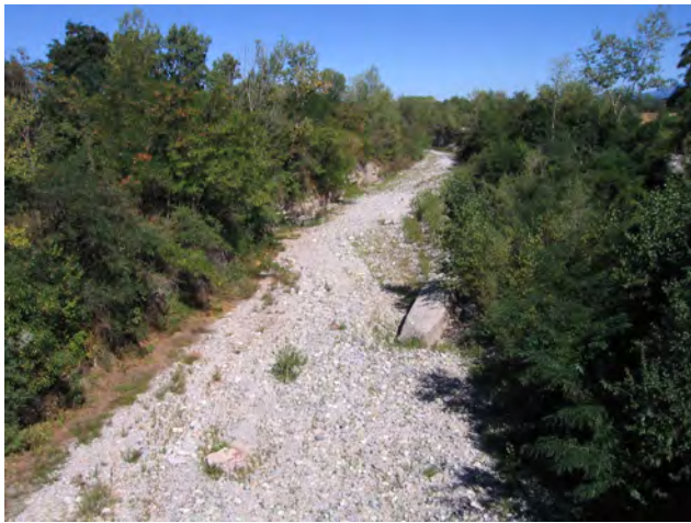
Grana a Caraglio