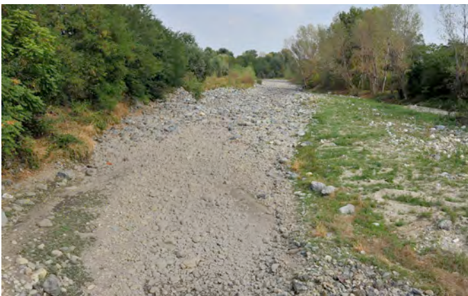
Sangone a Rivalta