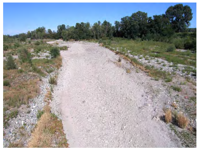
Varaita a Verzuolo