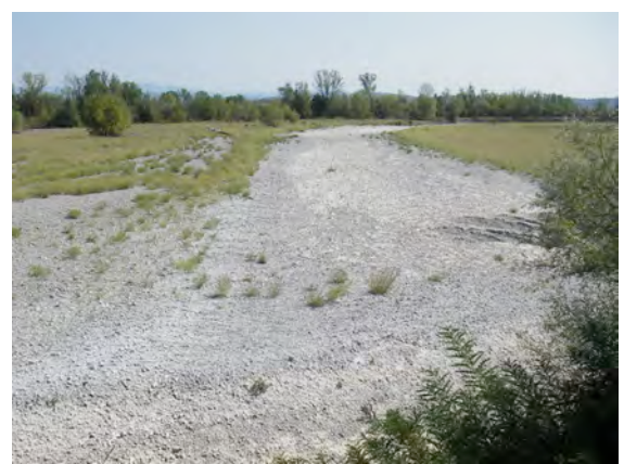
Scrivia a Castelnuovo.

Le risorse idriche sono utilizzate nei seguenti ambiti principali in termini di volumi “consumati” rispetto alla disponibilità idrica naturale media piemontese dei succitati 14 \cdot 10^9 \text{ m}^3/\text{anno} di deflussi superficiali 8 :